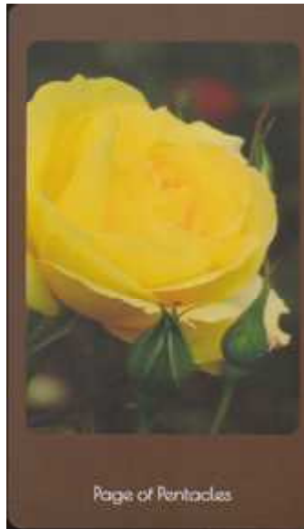
Page of Pentacles

Ten of Pentacles (ペンタクルの10) 使われた写真のバラの名 万葉。今の幸せがあるのは受け継いだものがあつたからです。それをどうやって次へと手渡ししましょうか。負の遺産になつてはなりません。