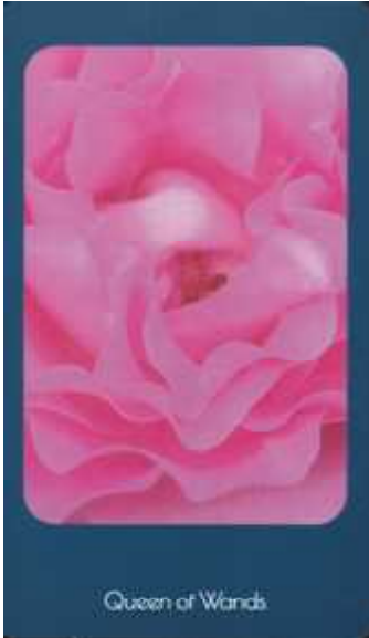
Queen of Wands

Knight of Wands (ワンドのナイト) 使われた写真のバラの名 コンデサ デ サスタゴ。向こう見ずで制御不能ほどの強い勢いで出立。自信たっぷりではなかな面も。他とのコミュニケーションが鍵です。