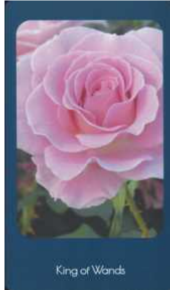
King of Wands

Queen of Wands (ワンドのクイーン) 使われた写真のバラの名 ビバリ。他を引きつける圧倒的な魅力を持ち、明るく、ポジティブで自信家。