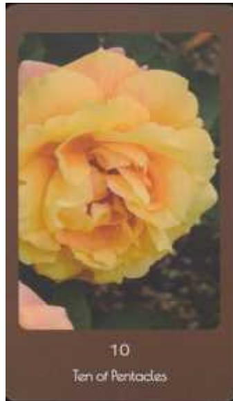
10 Ten of Pentacles