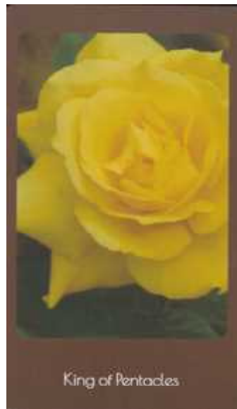
King of Pentacles

Queen of Pentacles (ペンタクルのクイーン) 使われた写真のバラの名 イエロー ビノキオ。心配りがきき、度量広く相手を受け入れます。現実的でよく気がつき、ポジティブ。暖かく、信頼がおけます。