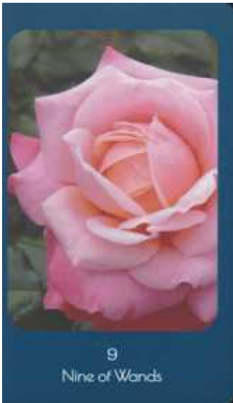
9 Nine of Wands

Nine of Wands (ワンドの9) 使われた写真のバラの名 プリンセス チチブ。やることは全てやり目標には達しましたが、傷を負いました。その経験がトラウマとなりますか、それともそれを糧として次に備えることができますか。