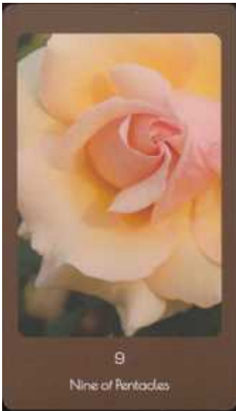
9 Nine of Pentacles