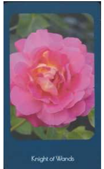
Knight of Wands

Page of Wands (ワンドのページ) 使われた写真のバラの名 ブルーバビューム。インスピレーション、夢中になるきっかけ、チャンスの訪れです。明るい未来を見つめます。