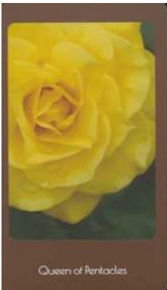
Queen of Pentacles

Knight of Pentacles (ペンタクルのナイト) 使われた写真のバラの名 伊豆の踊子。注意深く、慎重で、現実的にものごとを見据えています。用心深さが吉か凶か。まだ動き出してはけません。