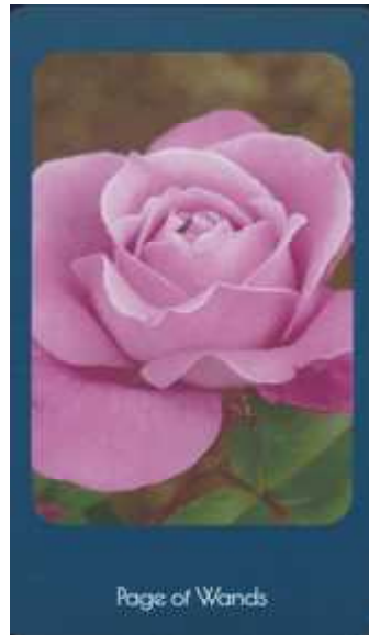
Page of Wands

Ten of Wands (ワンドの10) 使われた写真のバラの名 グレース ドゥ モナコ。つらいのは何もかも引き受けるからです。物理的、精神的に重荷を軽くしたいかが？