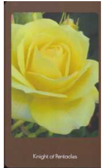
Knight of Pentacles

Page of Pentacles (ペンタクルのページ) 使われた写真のバラの名 サハラ '98。チャンスの訪れを告げるメッセンジャー。時間を積み重ね、真面目にものごとに取り組むか否かで将来が変わってきます。