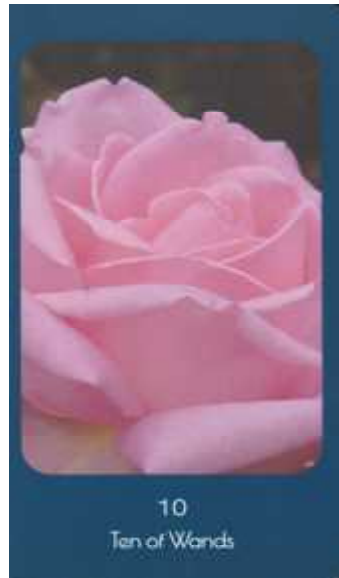
10 Ten of Wands

Nine of Wands (ワンドの9) 使われた写真のバラの名 プリンセス チチブ。やることは全てやり目標には達しましたが、傷を負いました。その経験がトラウマとなりますか、それともそれを糧として次に備えることができますか。